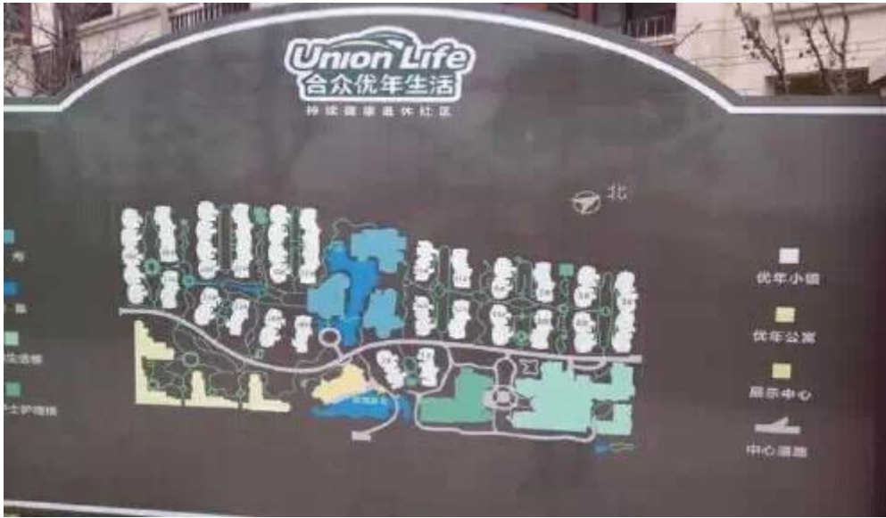
图 8：合众养老社区外景