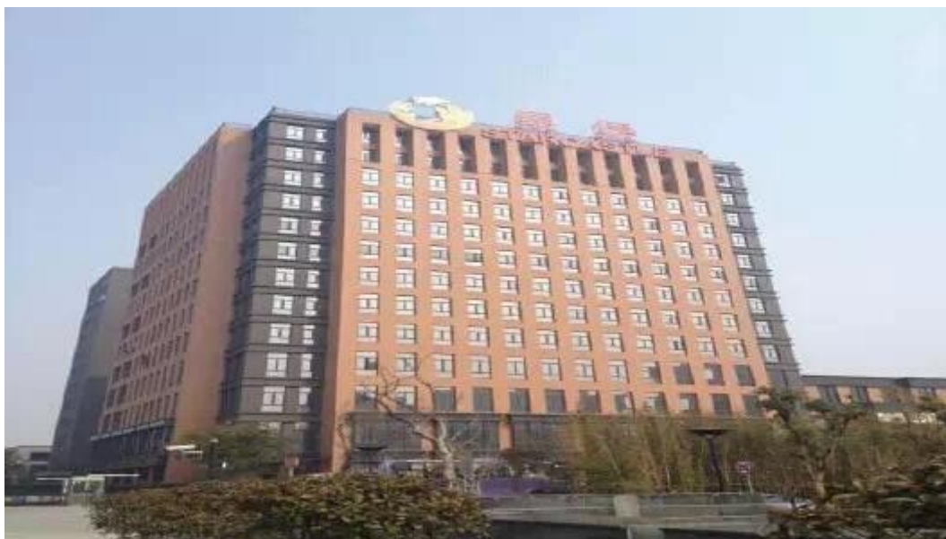
图 5: 星堡中环养老社区

收费采取“月费涵盖全包式”, 一次性 5 万元左右的入住费, 叠加自理单元服务费, 每月费用从 7100 元到 3 万元不等, 服务内容包括一日三餐、公共事业费和维护费, 每周一次的客房清洁、社区内设医疗诊所服务等, 合同期为一年期。